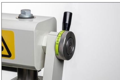
Justering av presstryck för bästa resultat och enkelt att ställa in.