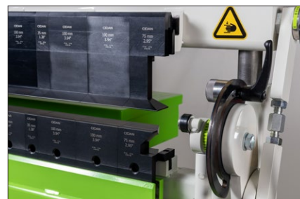
Hörnverktyg som standard för maximal flexibilitet. Verktygshöjd i underbalken är 60 mm och verktygen i böjbalken är 94 mm höga.