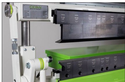
100 mm höga lådverktyg med snabbblåsning, enkla att flytta. Generös öppningshöjd på 100 mm.